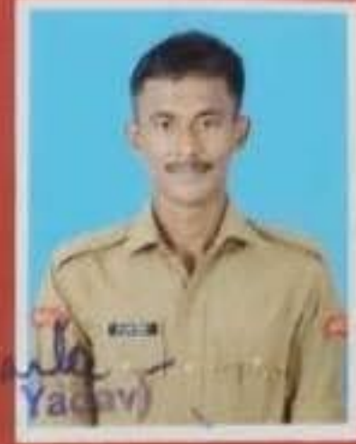
Col Commanding Officer 28 (TN) Bn NCC Virudhunagar