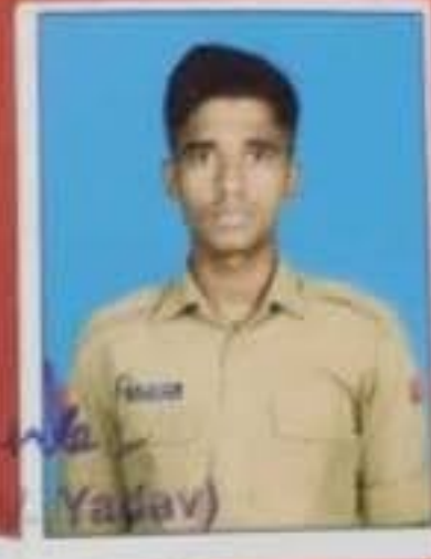
Col Commanding Officer 28 (TN) Bn NCC Virudhunagar